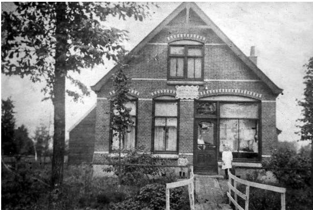
Hoofstraat 66 te Oud-Schoonebeek